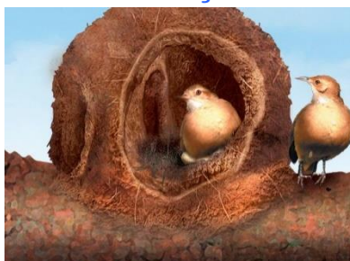
FOTO INSPIRAÇÃO PARA A CONSTRUÇÃO DA CASA DO JOÃO DE BARRO